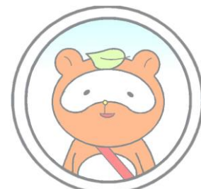
高松医療センター マスコットキャラクター 新田乙八 (にったおとはち)